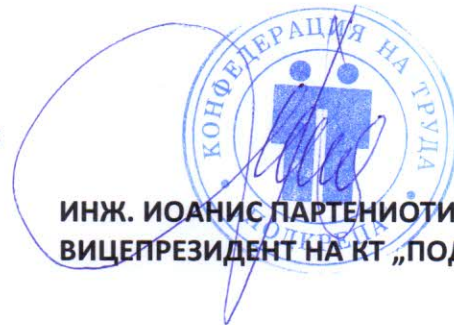
ИНЖ. ИОАНИС ПАРТЕНИОТИС ВИЦЕПРЕЗИДЕНТ НА КТ „ПОДКРЕПА“